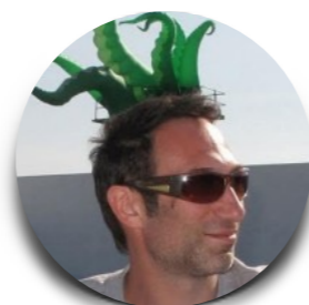
Filthy Luker UK