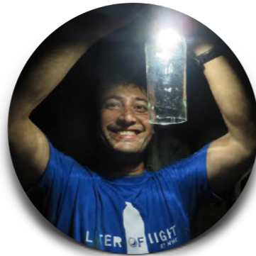
Illac Diaz Philippines

Daan Roosegaarde est un artiste, inventeur, architecte et entrepreneur qui explore la relation entre les personnes, la technologie et l'espace. Parmi ses projets les plus emblématiques : Smart Highway (routes qui se chargent de la lumière du soleil et brillent la nuit), Waterlicht (qui montre la force de l'eau) et Smog Free Project (le plus grand purificateur d'air extérieur). Daan Roosegaarde a reçu une dizaine de distinctions internationale, notamment la London Design Innovation Medal. Il compte parmi les « creative change maker » de Forbes. @DaanRoosegaarde @SRoosegaarde