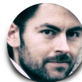
Charles Adrien Louis AVENIR CLIMATIQUE France