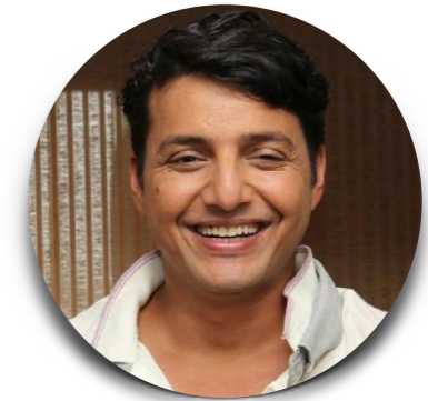
Afroz Shah Inde