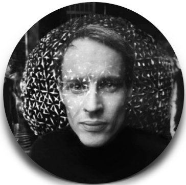
Daan Roosegaarde Pays-Bas

Le second Conclave va rassembler 21 personnalités exceptionnelles ! Voici un aperçu de ceux qui ont déjà donné un accord de principe :