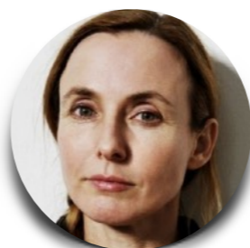
Nathalie Jeremijenko USA