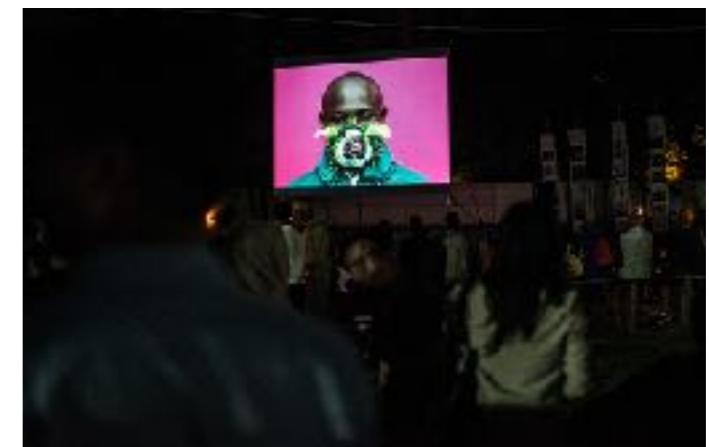
Projection de portraits Maskbook à Angkor Photo Festival