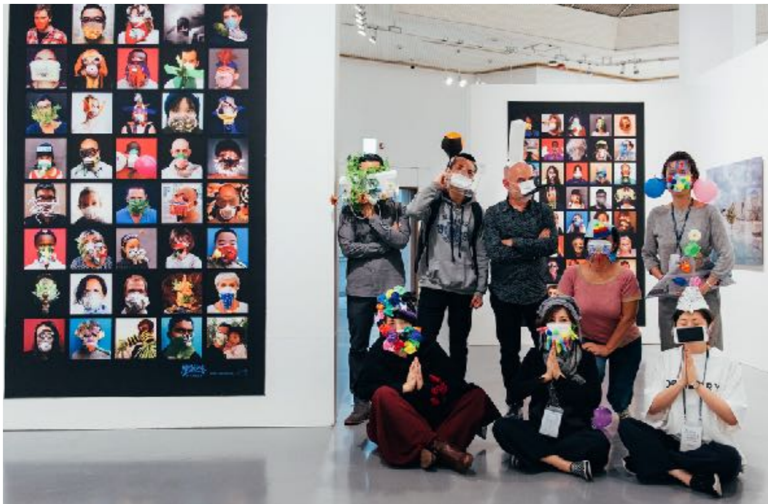
Exposition Maskbook à la Biennale de photographie de Daegu

À L'INTERNATIONAL (SÉLECTION) : Biennale de photographie de Daegu, Corée du Sud (2016) ; La Galerie, Hong Kong (2016) ; Habitat III, Équateur (2016) ; Angkor Photo Festival, Cambodge (2016) ; Café Clock Marrakech, Maroc (COP22, 2016)