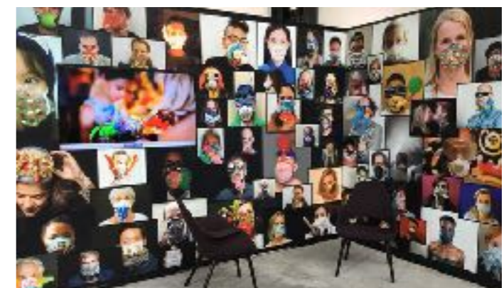
Exposition au Grand Palais à Paris durant la COP21