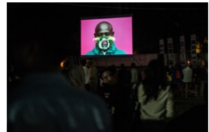
Projection de portraits Maskbook à Angkor Photo Festival