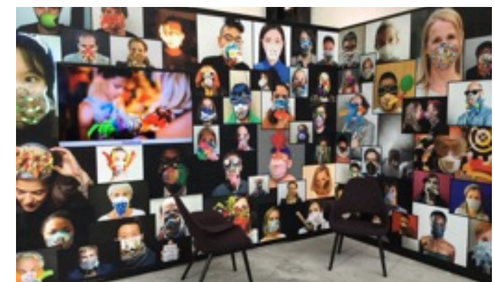
Exposition au Grand Palais à Paris durant la COP21