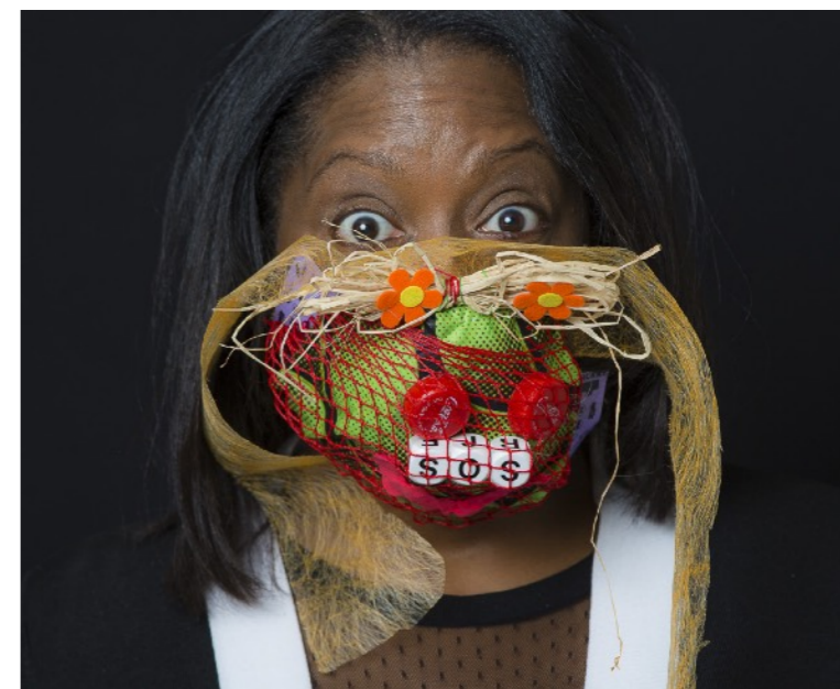
Atelier MASKBOOK aux bureaux de l'ONU Environnement à Paris