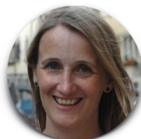
Lucy Orta Royaume-Uni