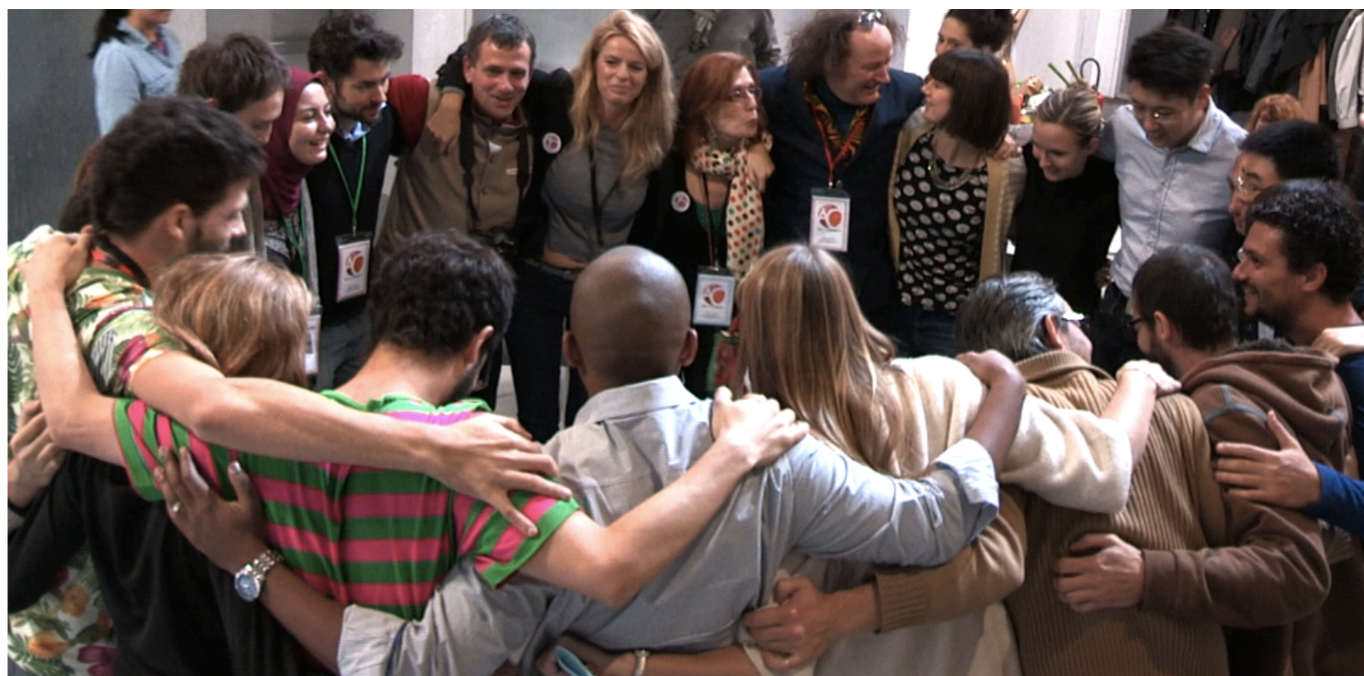
Les « 21 » à la Gaîté Lyrique lors de la clôture des débats

Modèle économique : Des soutiens privés et publics. Art of Change 21 a financé la venue de l'ensemble des participants (trajet, logement, visas, frais...).