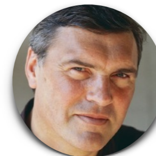
Paul Ardenne Critique d'art