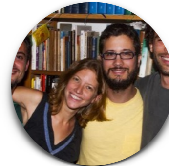
Opavivará ! Colectivo Brésil