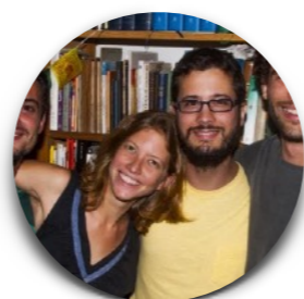
Opavivará ! Colectivo Brésil