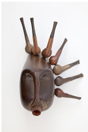
Romuald Hazoumé, La Sultane , 2016, Collection Longchamp