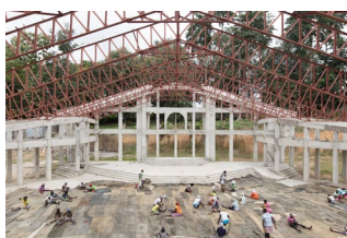
Ibrahim Mahama, K.N.U.S.T Catholic Church . Site de production. 2016. K.N.U.S.T Kumasi Ghana. Courtesy de l'artiste

Ensemble, ils ont imaginé l'action Maskbook qui mobilise sur la pollution de l'air et le climat par la créativité et le DIY (Do It Yourself). Lancée par Art of Change 21 et les membres du Conclave 2014 pendant la COP21, Maskbook ( www.maskbook.org ) connaît un fort succès international et un déploiement rapide, avec déjà plus de 50 événements dans le monde.