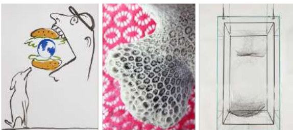
Exposition collective Biocenosis21. Commissaire d'exposition : Alice Audouin

Art of Change 21 rassemble les artistes contemporains les plus emblématiques et inspirants au sein de l'exposition collective Biocenosis21 (commissaire : Alice Audouin) au cœur des Espaces Générations Nature du Congrès et lors de tables rondes, ateliers, etc. Dans la ville de Marseille, Art of Change 21 s'allie avec un nouveau lieu culturel, La Traverse, pour proposer dès le 28 août lors d'ART_O_RAMA, une exposition, des échanges et des rendez-vous culinaires autour de Biocenosis21 dont un Food For Art avec la Maison Ruinart.